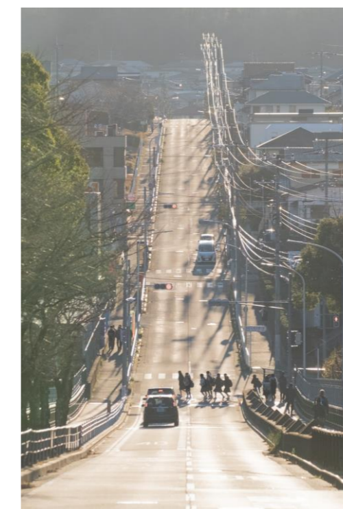
昨年度フォトコンテスト優秀作品